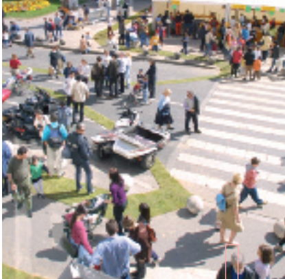
↳ Animations extérieures