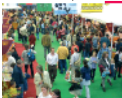
↳ Troisième Fête du livre jeunesse 2002.