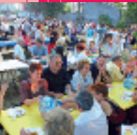
↳ Repas de quartier 2002.

Au XIX e siècle, les nombreuses « amicales » se réunissaient dans les cafés où l'on partageait toutes les passions qui construisent les sociétés. Sport, culture, économie, humanitaire, jeux, courses étaient autant de motifs de retrouvailles et de fêtes. Dès 1977 s'imposa une nouvelle génération de fêtes totalement gratuites, associant toutes les énergies de la ville : à Villeurbanne en Fête succédèrent les Eclanova et la Folia (fête associative), puis les Vivats, et enfin, dans une version toujours plus conviviale, les Invites.