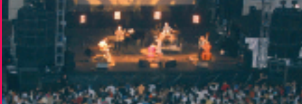
↳ Concert de Paris Combo, place Lazare Goujon 2002.