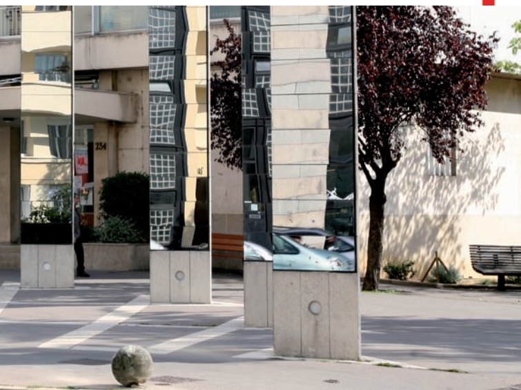
➤ Le Centre culturel et de la vie associative, 234, cours Emile Zola.

La mise à disposition des salles est surtout ponctuelle, mais elle peut être annuelle. Des associations peuvent également être domiciliées au CCVA.