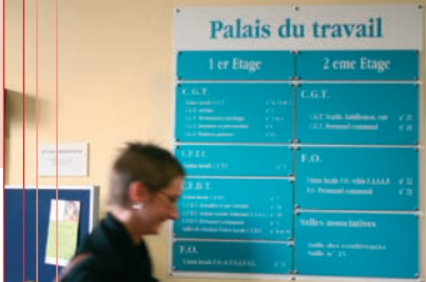
→ Panneau des syndicats au Palais du Travail.