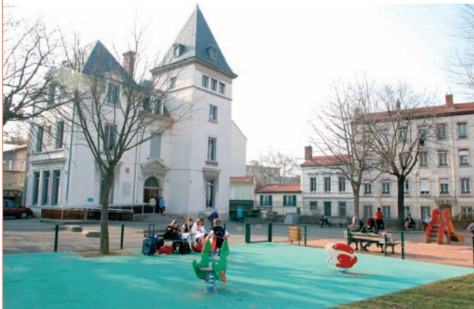
→ La maison Berty-Albrecht

Maison Berty-Albrecht : 14 place Grandclément. Renseignements : 04 78 68 19 86 ou 04 78 54 78 18.