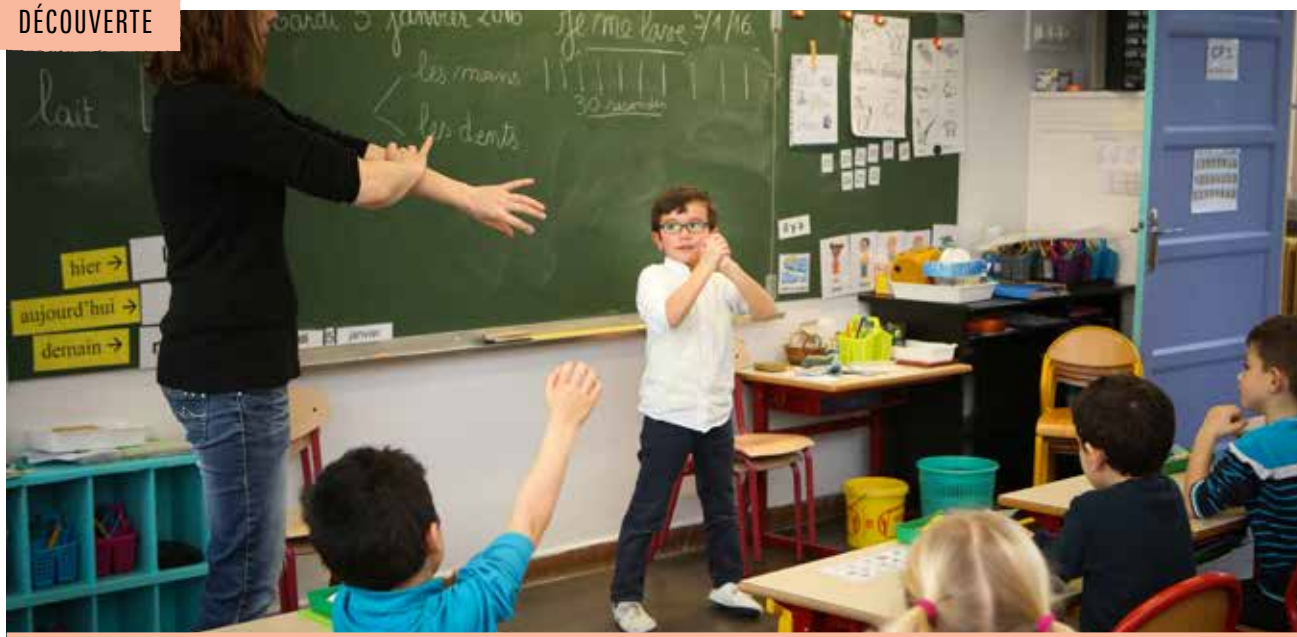
Dépistage et prévention, deux principales missions du service municipal de santé scolaire