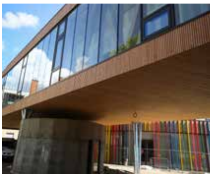
Travaux à l'école Berthelot.

L'isolation thermique du groupe scolaire Lazare-Goujon a commencé cet été et devrait se terminer en février 2018. Au programme : isolation thermique par l'intérieur et l'extérieur, pose de menuiseries à double ou triple vitrage, isolation des planchers... Les objectifs sont d'obtenir qualité et confort thermiques en hiver comme en été, d'améliorer l'esthétique et de diminuer les consommations d'énergie. À l'école Berthelot, le vaste chantier se poursuit pour l'extension et la restructuration de l'ensemble. La rénovation du rez-de-chaussée de l'élémentaire est terminée et le bâtiment-pont est bien avancé et sera terminé à la fin de l'année. La rénovation du bâtiment existant de la maternelle débutera en janvier 2018.