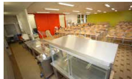
Le nouveau self du groupe scolaire Jean-Zay.

La rentrée s'est faite dans un nouveau décor au groupe scolaire du Tonkin où les travaux sont finis depuis juin. Il compte 4 classes supplémentaires, un ascenseur, de nouveaux espaces extérieurs (patios, jardin pédagogique...).