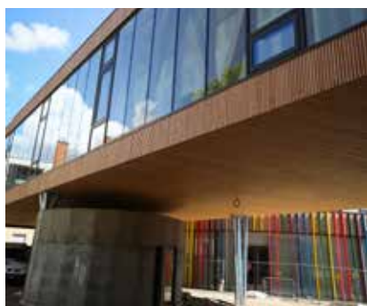
Travaux à l'école Berthelot.

L'isolation thermique du groupe scolaire Lazare-Goujon a commencé cet été et devrait se terminer en février 2018. Au programme : isolation thermique par l'intérieur et l'extérieur, pose de menuiseries à double ou triple vitrage, isolation des planchers... Les objectifs sont d'obtenir qualité et confort thermiques en hiver comme en été, d'améliorer l'esthétique et de diminuer les consommations d'énergie. À l'école Berthelot, le vaste chantier se poursuit pour l'extension et la restructuration de l'ensemble. La rénovation du rez-de-chaussée de l'élémentaire est terminée et le bâtiment-pont est bien avancé et sera terminé à la fin de l'année. La rénovation du bâtiment existant de la maternelle débutera en janvier 2018.