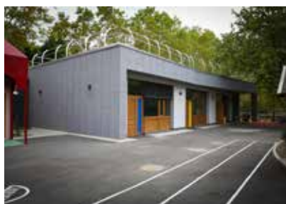
Le groupe scolaire du Tonkin.

La rentrée s'est faite dans un nouveau décor au groupe scolaire du Tonkin où les travaux sont finis depuis juin. Il compte 4 classes supplémentaires, un ascenseur, de nouveaux espaces extérieurs (patios, jardin pédagogique...).