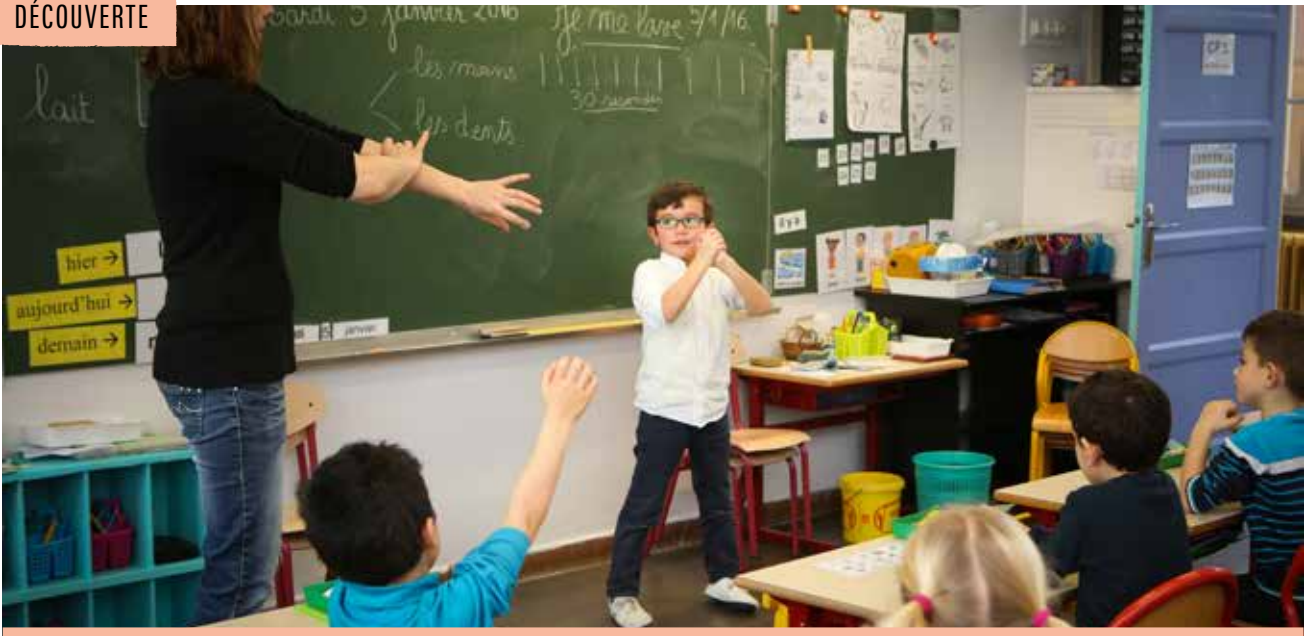
Dépistage et prévention, deux principales missions du service municipal de santé scolaire