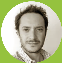
Directeur de l'agence paysagère The Good Factory