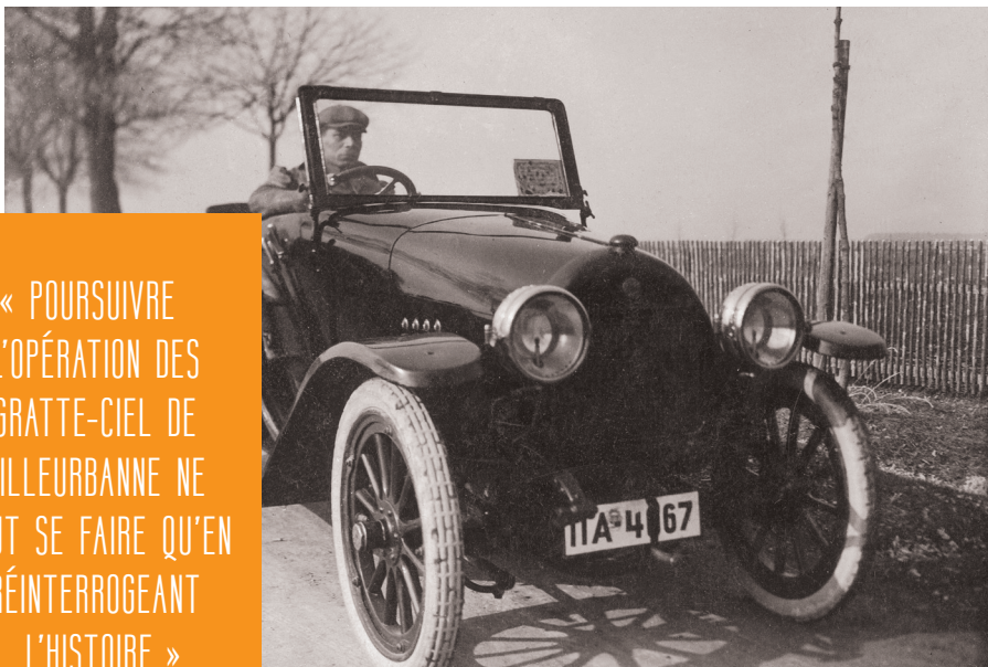
▲ Peugeot type 163

La nouvelle histoire qui s'écrit pour Gratte-Ciel centre-ville prend ses racines dans le quartier historique.