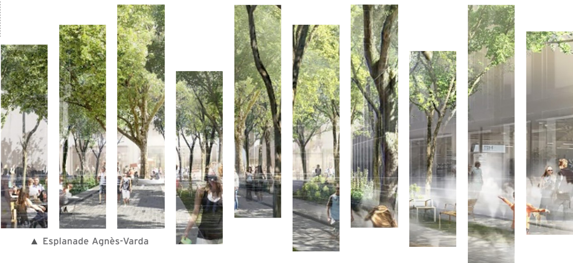
▲ Esplanade Agnès-Varda