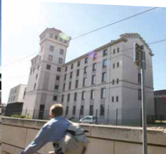
Pôle Pixel Grands moulins de Strasbourg