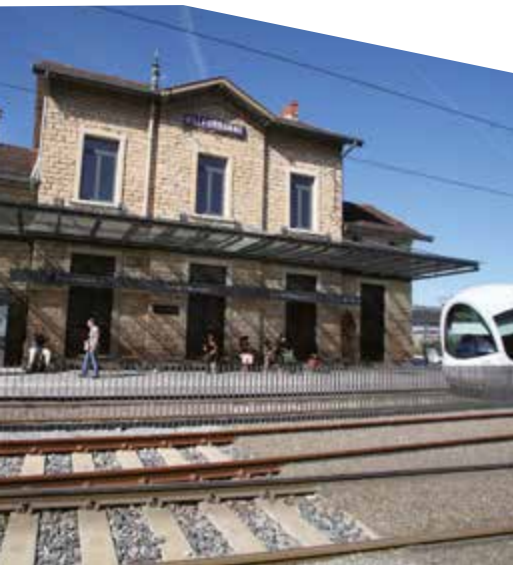
Gare de Villeurbanne Ancienne ligne de l'Est