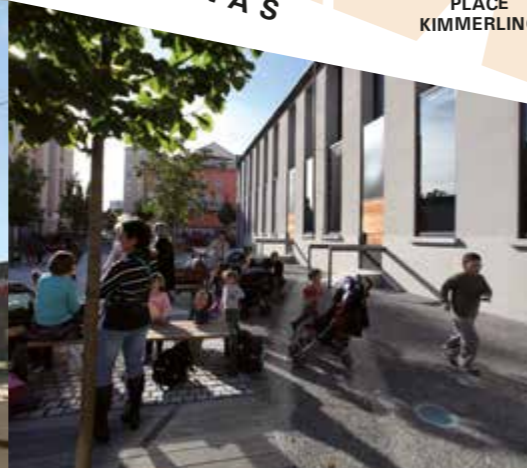
Le Rize Médiathèque - Archives municipales