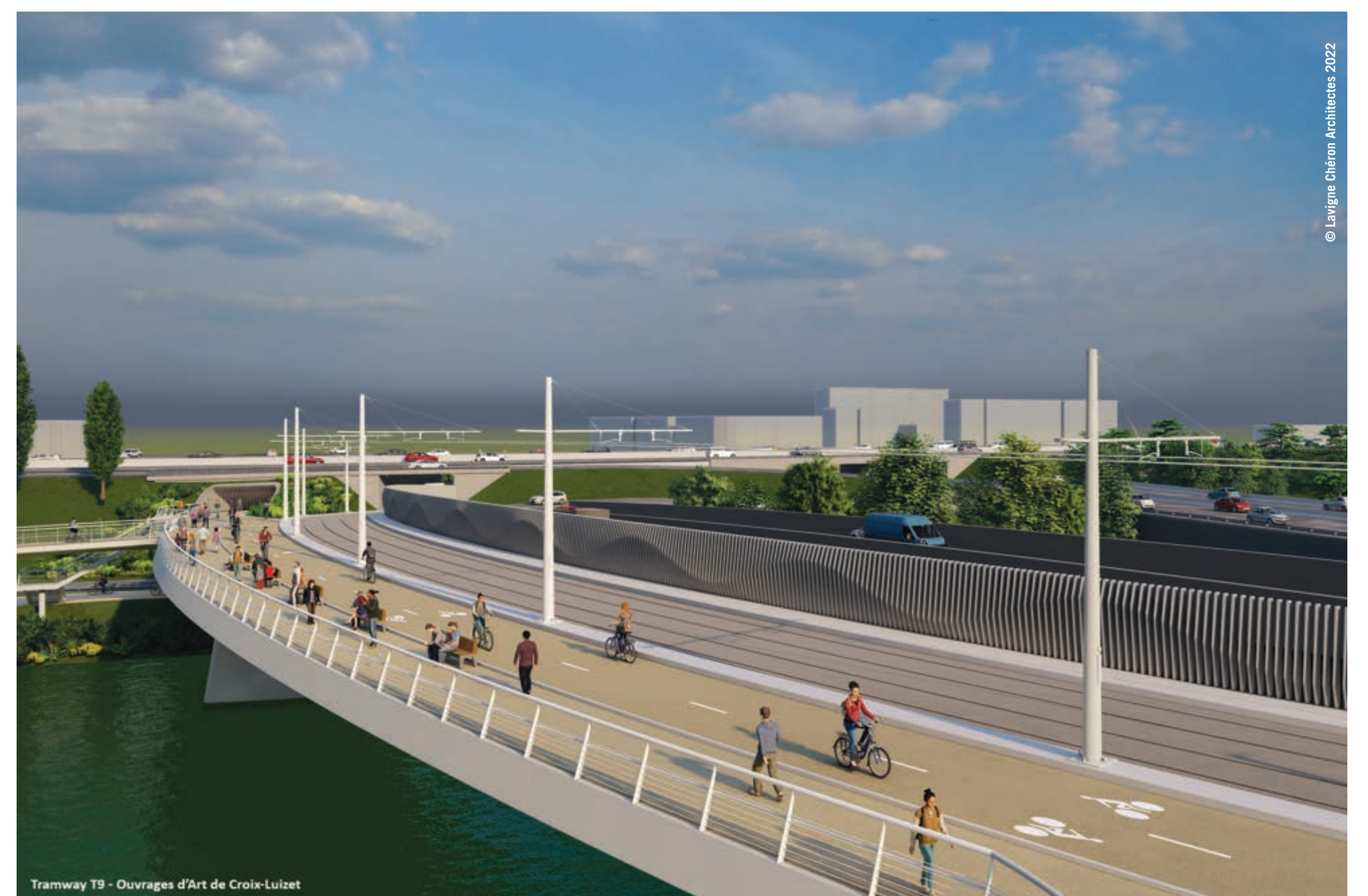
Une nouvelle traversée du Canal de Jonage