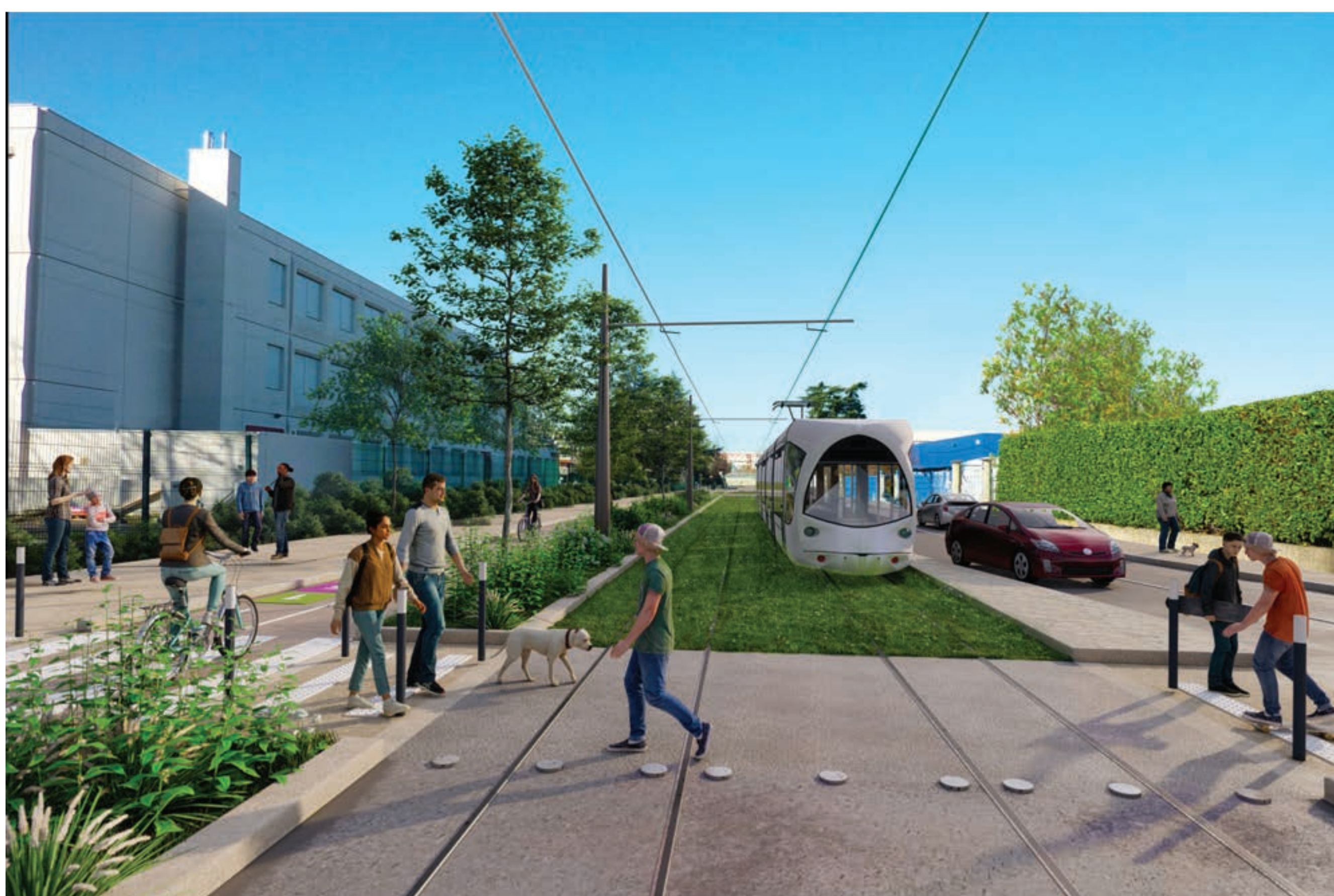
Le futur de l'allée du Mens

Sur tout son parcours dans la ZAC Saint-Jean, T9 contribuera à améliorer le cadre de vie et à rafraîchir le quartier en été, par la plantation de végétaux.